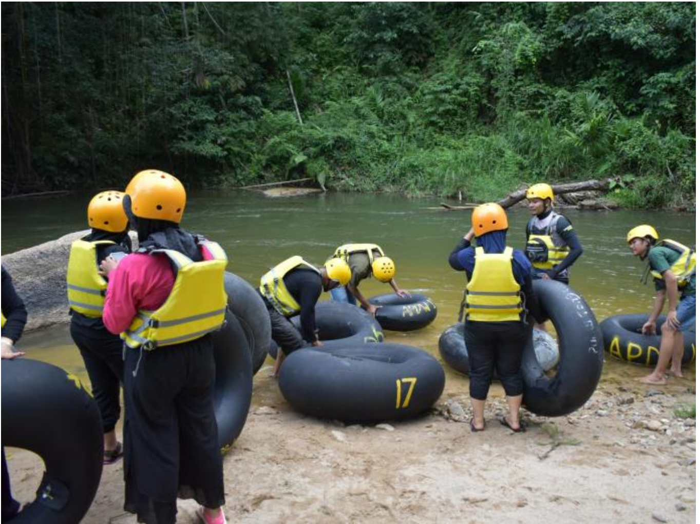
Cak Benan / Tubing Nagari Sisawah