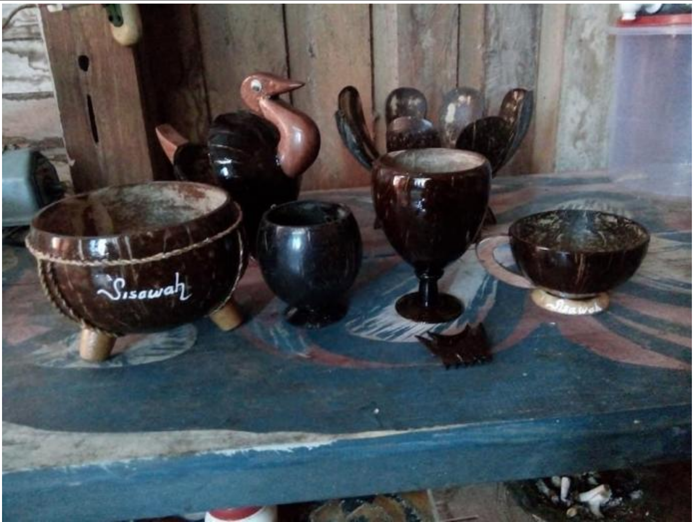
Suvenir Batok Kelapa